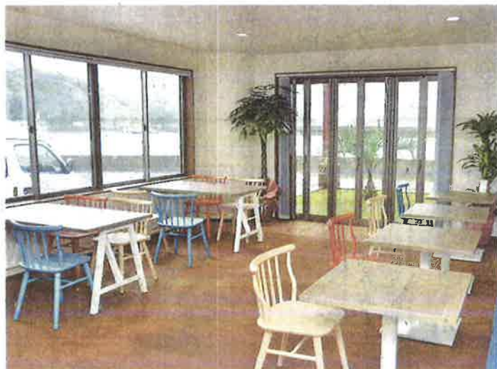
開放的な雰囲気のカフェ

「石の島」として知られる笠岡諸島の北木島に10月末オープンした「K's LABO(ケーズ・ラボ)」。日本銀行本店や明治生命館、靖国神社大鳥居など名だたる建造物に用いられた「北木石」の歴史・文化を伝えるストーンミュージアムのほか、カフェやレンタサイクルステーションを備えている。瀬戸内海エリアに誕生した新たな観光拠点を写真で紹介する。(斎藤英宗)