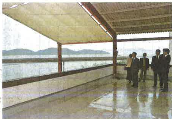
瀬戸内の多島美が見渡せるテラス

メモ K's LABOは石材加工業「鳴本石材」(笠岡市茂平)が、豊浦港近くの旧石材加工場2棟を改装して整備。開館日は火、木、土、日曜日と祝日の午前10時~午後4時。問い合わせは同石材(0865661414)。