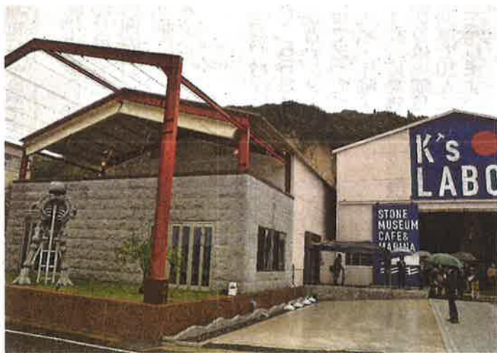
淡いピンクを基調としたK's LABOの外観。石でつくった恐竜のオブジェが迎えてくれる