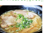
↑カメノテラーメンは塩味と醤油味の二種類。