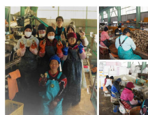
養殖牡蠣の出荷までの過程を見学することができます。(11月~5月まで)