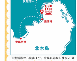
※豊浦港から徒歩1分、金風呂港から徒歩20分